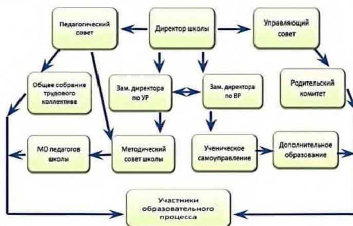
Структура и органы управления образовательной организацией

В МБОУ «СОШ №6» г. Аргун реализуются следующие общеобразовательные программы: